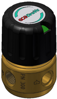
4-Port Ventil 1 Eingang; 3 Ausgänge

Absperrventil mit einer Edelstahlmembran zum Einsatz in industriellen Gasversorgungsanlagen mit inerten, brennbaren, oxidierenden Gasen. Für den Gebrauch für korrosive, toxische Gase ist das Ventil nicht geeignet.